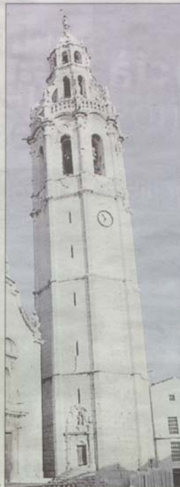
Campanario de Alcalà de Xivert.